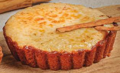
Nuevo TARTA DE ARROZ CON LECHE