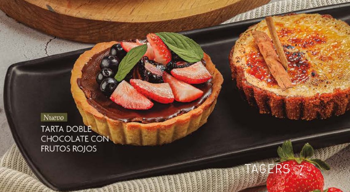
Nuevo TARTA DOBLE CHOCOLATE CON FRUTOS ROJOS